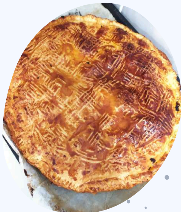
Galette des rois