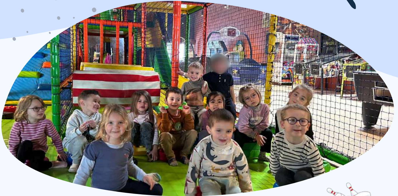
Matinée parc kid's fun pour nos petits !