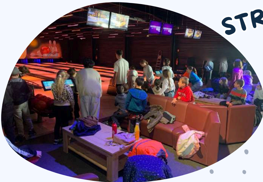
Et bowling pour nos grands !