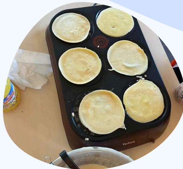
Crêpes pour la chandeleur