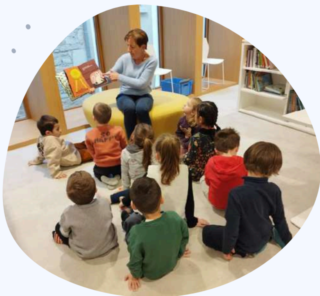
Matinée à la médiathèque